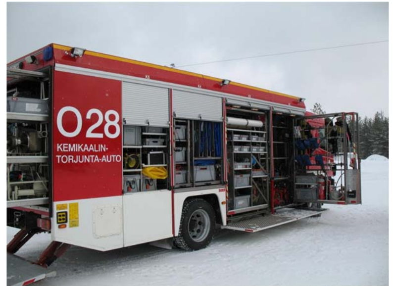
1-2 LFs + 1 GW-G