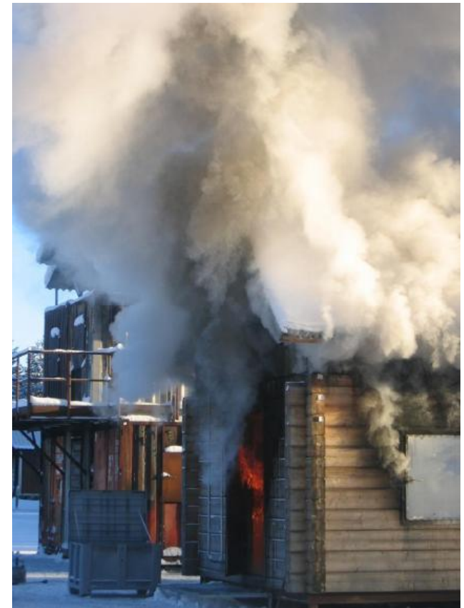
Entwickelter Brand (vor Einsatz)